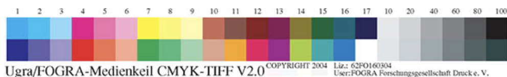
Рис.1. Тестовая шкала UGRA/FOGRA MediaWedge v.2.0.