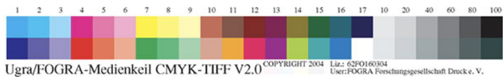
Рис. 1. Тестовая шкала UGRA/FOGRA MediaWedge v.2.0.