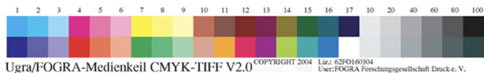
Рис.1. Тестовая шкала UGRA/FOGRA MediaWedge v.2.0.

8) Цветные распечатки, без контрольной шкалы и информации об использованных ICC – профилях, не являются цветопробами